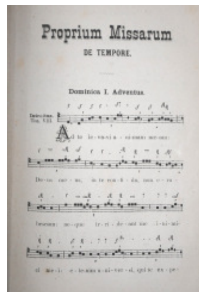
Graduale ad normam cantus S. Gregorii, 1. Seite