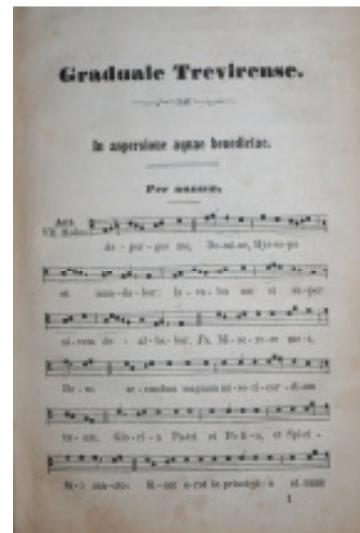
Graduale Trevirensis, Seite 1

Nach seiner Priesterweihe am 28. August 1859 wirkte er in den folgenden drei Jahren als Kaplan in Cues und Bernkastel an der Mosel, wo er gleichfalls die wertvollen Codices, die hier in der Bibliothek des Cusanushospitals aufbewahrt wurden, erforschen sollte. Aufgrund dieser Forschungsarbeiten gab er dann im Auftrag des Bischofs im Jahre 1863 – nunmehr schon als Domorganist – sein Graduale juxta usum Ecclesie Cathedralis Trevirensis , wenig später und ebenfalls nach alten trierischen Handschriften die Præfationes , ein Antiphonale sowie ein Kyriale heraus. Hierauf aufbauend schloss sich die Edition der Harmonia cantus choralis an, für welche er die gregorianischen Gesänge für den orgelbegleiteten Vortrag oder die Ausführung durch einen vierstimmigen Chor (!) bearbeitete. Auch die 1871 von ihm vorgenommene Neuausgabe des Trierischen Diözesangesangbuches enthielt in seiner vierstimmigen Fassung eine große Zahl derartig ausgesetzter Choräle „nach trierischer Singweise“, die der Harmonia cantus choralis entnommen waren.